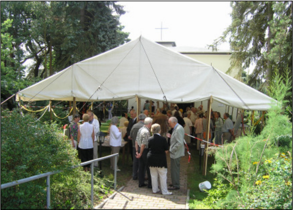
„Small Talk“ unter dem Festzelt vor der Dreikönigskirche in Rahnsdorf

75 Jahre „Kirche auf dem Berg“ Jubiläumswochenende von 3. bis 5. Juli 2009 in Heilige Dreikönige Berlin-Rahnsdorf