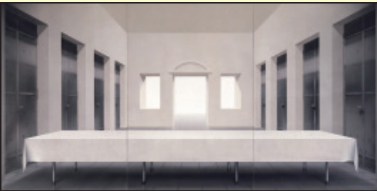
Das Abendmahl von Ben Willikens, 1976, der Künstler (72) lebt und arbeitet in München und Stuttgart

Der zeitgenössische Maler und Künstler Ben Willikens stellt dieses Bild aber 1976 dar als gleichsam leeren Raum, ohne Licht. Ein weiß gedeckter Tisch,