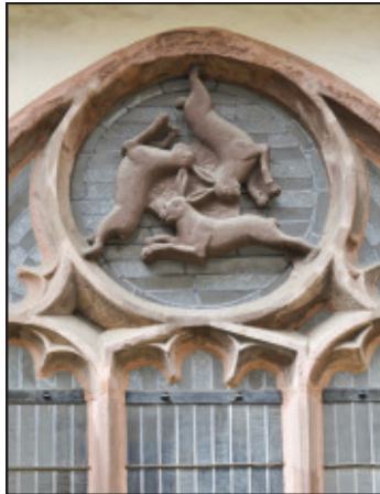
Das Drei-Hasen-Fenster des Paderborner Doms verdeutlichte in der mittelalterlichen Zahlenmystik die Einheit Gottes in der Dreifaltigkeit

Pfarrer Josef Ernst (Münster) Text und Bild: Pfarrbriefservice.de