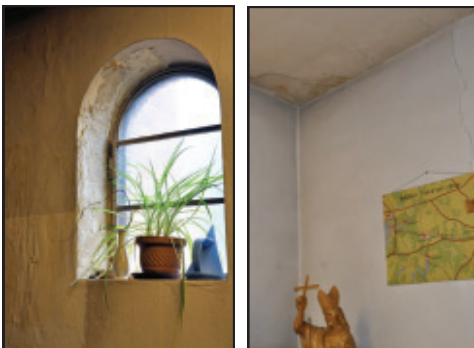
Oben: Die Sakristei in all ihrer „Pracht“ Unten: Schlimme Stellen an Fenster und Decke