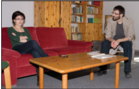
Bei der Probe des Theaterstücks „Die Physiker“ von Dürrenmatt, Marlene spielt die „Verrückte Doktorin“

Doch es ist nicht so als müsste ich mich rund um die Uhr nur mit Formeln und Zahlen beschäftigen. Ich habe auch genug Zeit, um alle Vorzüge des Studentenlebens auszukosten. Auch die katholische Studentengemeinschaft kann einen Terminkalender in jeder Hinsicht füllen, mit Chor, Vortragsabenden, Theater oder einfach geselligem Beisammensein.