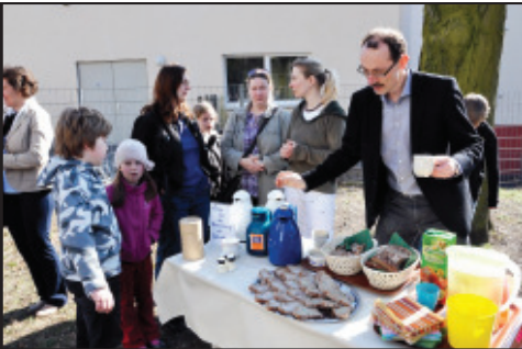
Neben Kaffee und Kuchen gibt es beim Stehkaffee am 25. März auch leckere Schmalzbröte

Konkret heißt das, mit der Gemeinde die Familiengottesdienste zu feiern, Feste mit vorzubereiten und durchzuführen, wie Sankt Martin, das Krippenspiel, Sternsingen oder Fasching. Wir unternehmen aber auch gemeinsam Fahrten, machen Ausflüge und treffen uns möglichst einmal im Monat, um uns auszutauschen und durch geistige Impulse unser Leben christlich auszurichten.