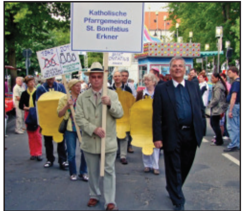
Unsere Gemeinde beim Festumzug 2011 (T.Frey)

Erkner und gestalten das Leben durch Aktion und Gebet mit – ein Wirken, das oft unsichtbar ist. Daher ist es umso wichtiger, beim Festumzug sichtbar durch die Friedrichstraße zu ziehen, unsere Kirche zu Besuch und Besichtigung zu öffnen und beim Chorfest und im ökumenischen Gottesdienst die Botschaft Jesu den Besuchern auf den Bänken und an den Zäunen zu verkünden.